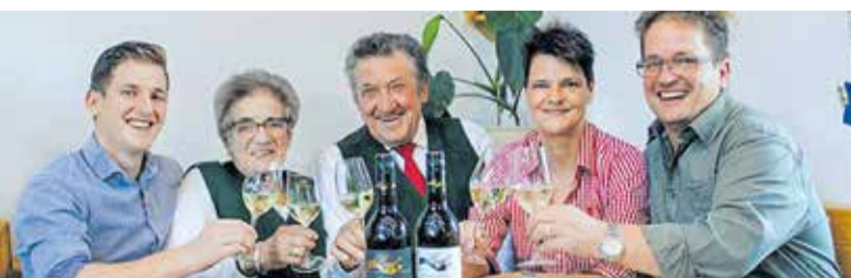
Weinfamilie Pugl

reich kann sich das Weinviertler Weingut Schmözl aus Münichsthal freuen. Allen ausgezeichneten Welschrieslingen gemein ist, dass sie leichtgewichtig sind, was auch viel vom Trinkspaß ausmacht.